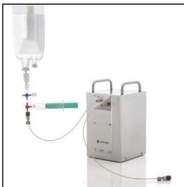
ガリウムジェネレータ