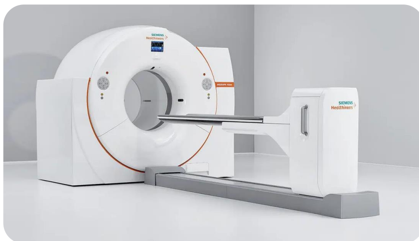
SIEMENS社製 半導体PET/CT装置 BIOGRAPH Vision450